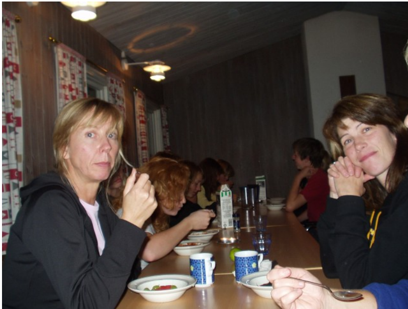
Delar av "markservicen" ( www.spk.nu )