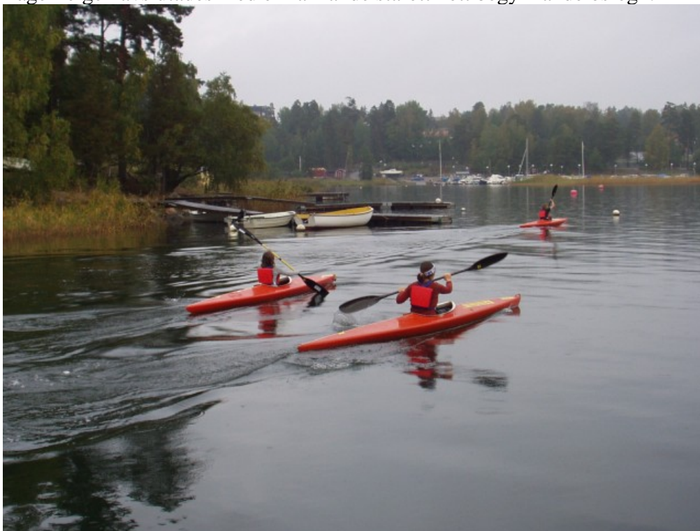
Jämt och spännande så det förslår... ( www.spk.nu )

Lägerhelgen avslutades med en rafflande stafett i ett begynnande ösregn.